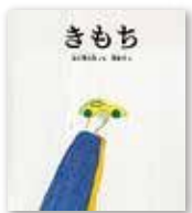
『きもち』 谷川俊太郎／文 長新太／絵 (福音館書店)

子どもへの「勇気づけ」の声掛け、対等な親子関係とは。ベストセラーになった『嫌われる勇気』の著者がアドラー心理学の考え方をもとに実践してきた子育てのコツをまとめた一冊。