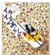
『イライラのあらし』 ルイズ・グレッグ／作 ジュリア・サルダ／絵 (金の星社)

友達のおもちゃをとりあげたときの気持ち、とられた子の気持ち・・・絵からいろいろな「きもち」が伝わります。自分の気持ち、人の気持ち、親子で一緒に考えてみませんか。