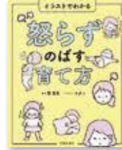
『怒らざるばす育て方』 篠 真希／著 (池田書店)

心療内科医が教える感情整理術の本。感情的になってしまう原因から、感情を落ち着かせる生活習慣、感情に左右されず幸せに生きるコツまでを、イラストを交えて解説しています。