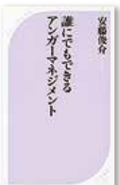
『誰にでもできるアンガーマネジメント』 安藤 俊介／著 (ベストセラーズ)

「怒り」はごく当たり前の感情です。この本では、自分の感情をコントロールする方法のほか、よくあるイライラの場面での子どもの心に働きかける叱り方・言葉かけについて、わかりやすくアドバイスしています。