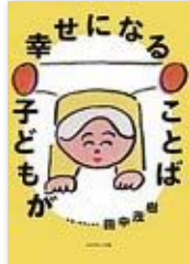
『子どもが幸せになることば』 田中 茂樹／著 (ダイヤモンド社)

目指すのは「怒らない人になるう」ではなく「怒りと上手に付き合えるようになるう」ということ。家庭でも仕事でも使える「怒り」の扱い方や対処法など、具体例を挙げて説明しています。