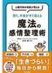
『心療内科の名医が教える怒り、不安がすぐ消える魔法の感情整理術』 ゆづき ゆづ／著 (日本文芸社)

子どもが元気になる関わり方などを日常生活の親子の関わりの中で実践できる「言葉かけ」にまとめたもの。つい「言いがちなことば」と子どもの元気を引き出す「信じることば」を対比して紹介しています。