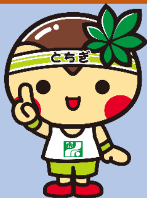
とちまるくん