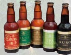
各種獨具風味的自造啤酒。到訪之際請一定品一下。

達到 46 公頃的寬闊占地中 除了農產物直銷處、使用本地食材的飲食設施等以外，還設置了可以體驗農業的農場、森林、多功能拱形設施、溫泉廣場、游泳池以及住宿設施等，是滯留型的道路車站。園內大致分為 3 大區域。擁有快樂購物及飲食、多目的體驗及溫泉住宿棟的“集中區域”。達到 10 公頃的自然林“異質之林”為中心的“森林區域”。以及“家鄉區域”，其中除了廣闊的草坪廣場以外，還有體驗農場和生產農場，成為可以體驗農業的遊玩區域。飲食不但可以享用當地食材的料理，還提供可以簡單帶走的美食。不只是作為旅行的休憩場所，魅力之處還在於豐富多彩的遊玩方式。