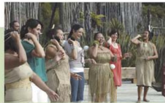
マオリカルチュラルセンター

オークランド市は、3つの港に囲まれ、海上交通が栄えたことからシティ・オブ・セイルズ(帆船の町)という愛称で親しまれている。豊かな自然環境を誇り、ハウラキ湾の海岸線には、大変美しいビーチが点在するほか、波の少ない入り江や港はマリンスポーツを楽しむ人で賑わい、ヨットレースなども行われる。ウィンヤード・クォーター、パイアダクト・ハーバー、クイーンズ埠頭などの再開発地区は、港湾都市オークランドの歴史的建造物をモダンな都市デザインに巧みに融合させ、調和のとれた雰囲気のあるウォーターフロントとなっている。