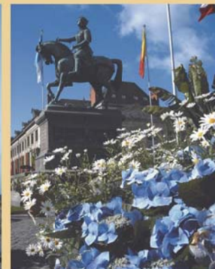
ジャンヌ・ダルク像