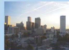
タルサ市中心の街並み

アーカンソー川に沿って、舗装道路が32kmに及びリバーパークでは、サイクリングや釣り、ボート、カヤックなどのアウトドアスポーツが楽しめる。