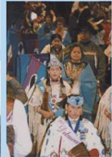
インディアンの衣装