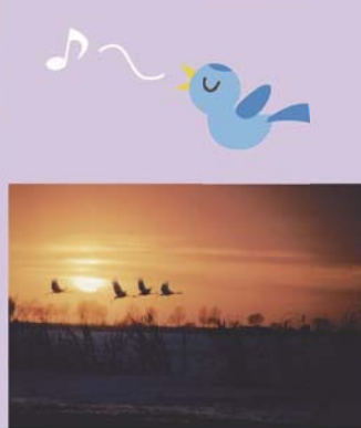
丹頂鶴と札龍自然公園