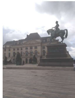
ジャンヌ・ダルクの像