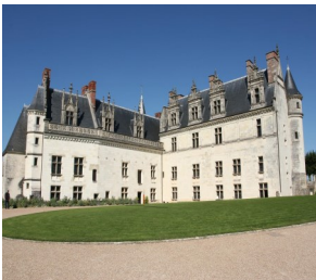
ロワール川の古城