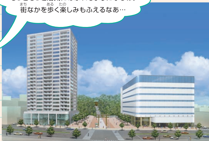
うつのみやば ばどお にし ち く し がい ち さい かい はつ じ ぎょう おもてさんどう ※宇都宮馬場通り西地区市街地再開発事業のイメージと「うつのみや表参道スクエア」