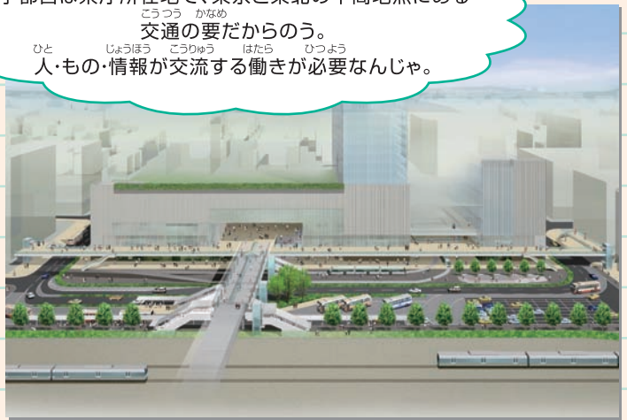
うつのみやえきひがしくちちくせいび うつのみやえきほうめん ※宇都宮駅東口地区整備のイメージ(宇都宮駅方面から)

うつのみや けんちようしよざいち どうきょう どうほく ちゅうかんちてん 宇都宮は県庁所在地で、東京と東北の中間地点にある こうつう かなめ 交通の要だからのう。 ひと じょうほう とうりゅう はたら ひつよう 人・もの・情報が交流する働きが必要なんじゃ。