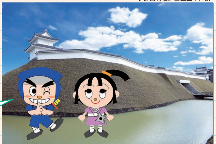
うつのみやじょうしこうえんどるい がいかん ※宇都宮城址公園土塁の外観