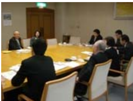
・ (株)サイエンス・クリエイト中野様から説明いただく