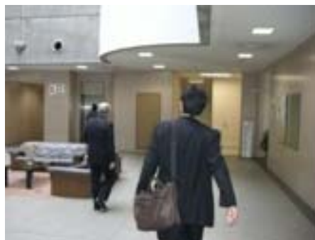
・ 展示スペースにもなるアトリウム