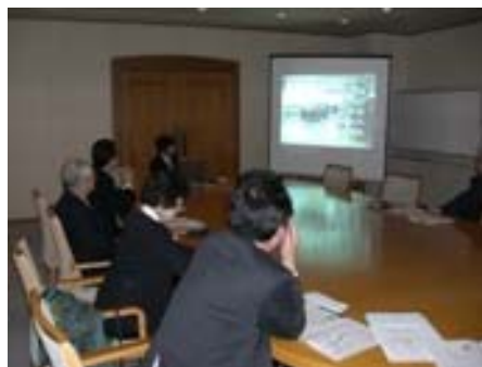
・ 当社P Vによるご説明