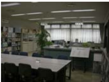
・ 地域連携・情報プラザの様子