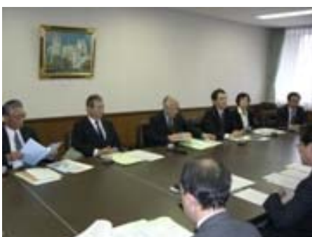
・ 豊橋市の皆様から説明いただく