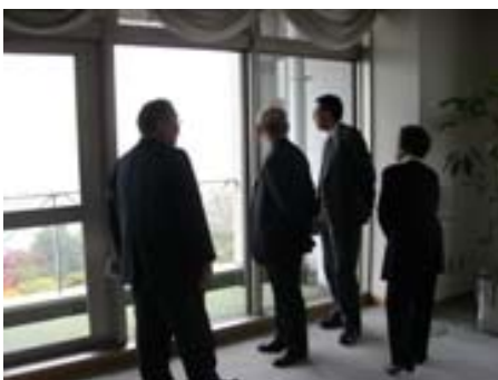
・ 庁舎 13 階から街並を望む