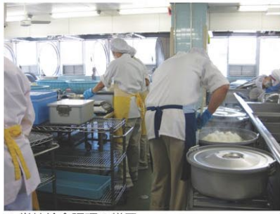
▲学校給食調理の様子

議案の概要 25年度学校給食調理業務委託において、委託を更新する33校及び新たに委託する5校合計38校の業務開始に向け、諸準備を計画的に行い、学校・業者双方の綿密な連絡調整のもと、4月から安全かつ安定した学校給食を実施するため、債務負担行為を新たに設定する。