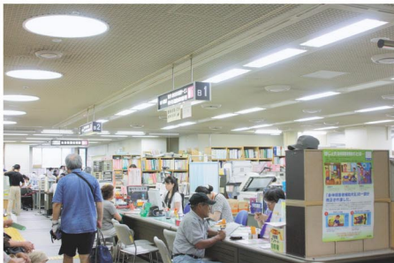
▲担当課の窓口の様子