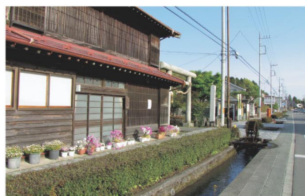
▲白沢宿のまちなみ

したことに伴い、届出規程の適用除外行為をより限定することにより、届出行為の対象を拡大する。