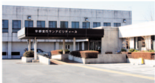
▲サン・アビリティーズ