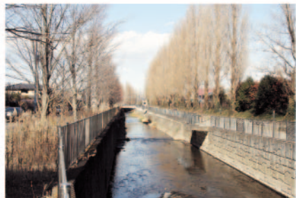
▲改修工事が実施される奈坪川