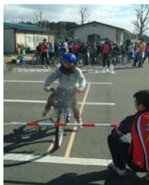
写真2 自転車教室の様子