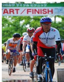
写真3 サイクルピクニックの様子