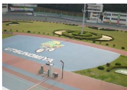
写真 5 競輪場内部の様子