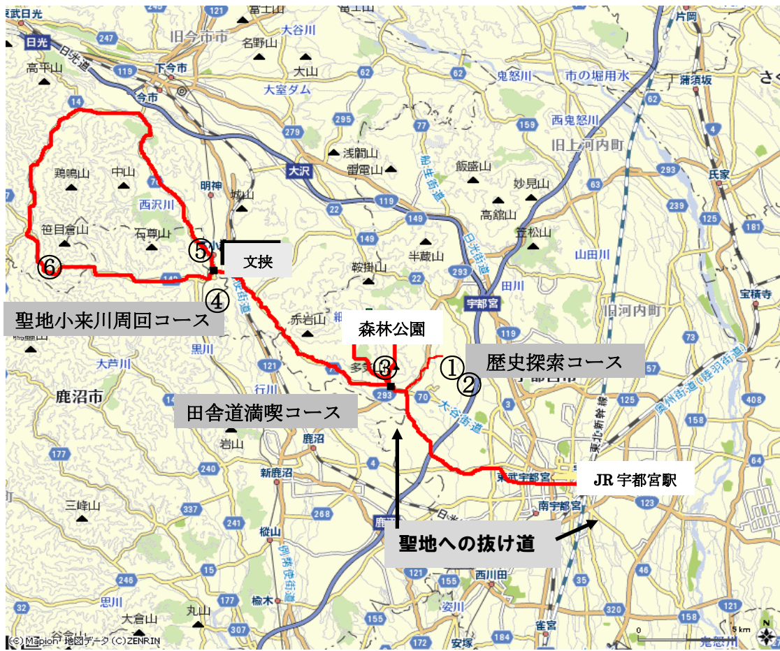
図表 3 「聖地攻略マップ」