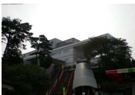
写真 4 競輪場入口の様子

年に一度、自転車に乗る事が出来ない小学生を対象に自転車教室を開催し、人気を集めている。しかし、講師を静岡の競輪学校から招いて指導をしているため、講師不足の問題は避けられない。そこで今年から「BLITZEN」の選手を講師として招き指導してもらう事を検討している。