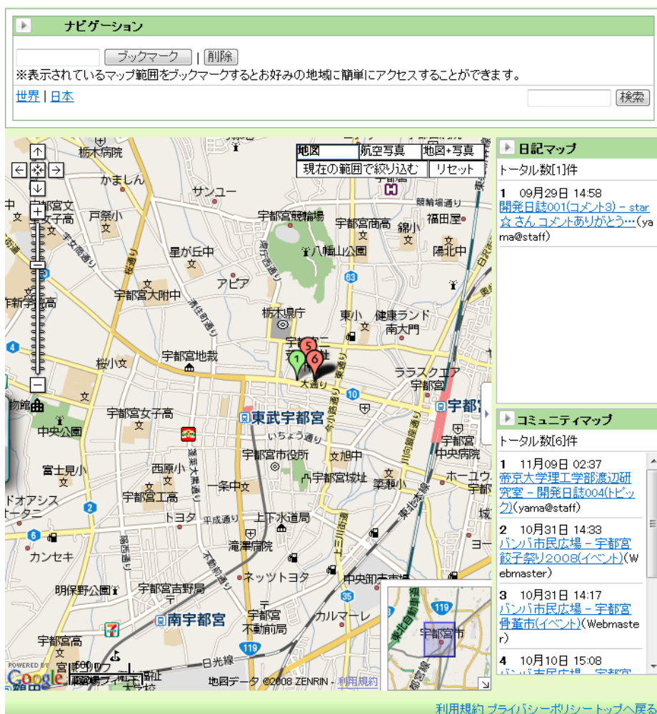
図 5. ソーシャルマップ