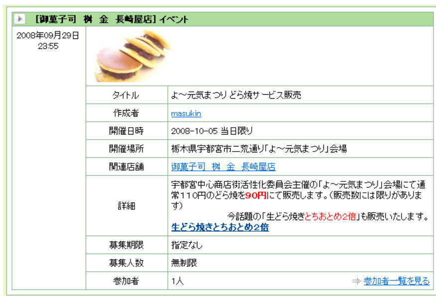
図 4. 店舗イベント情報