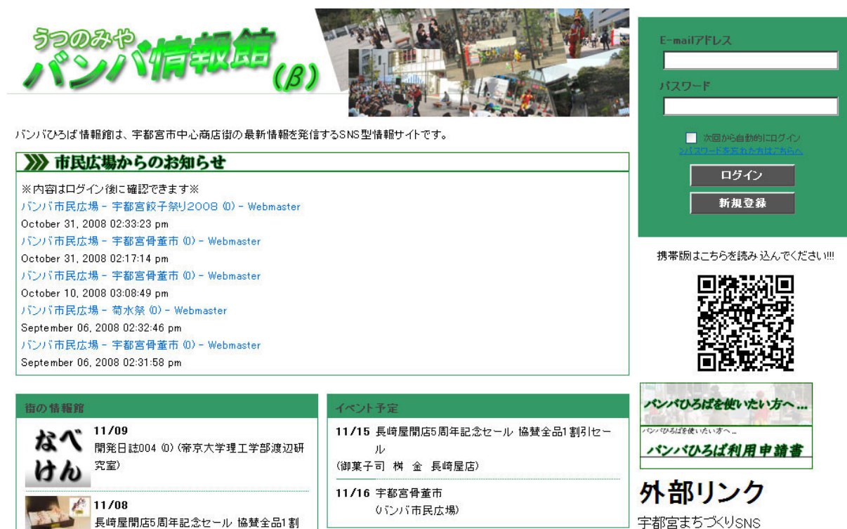
図 3. うつのみやバンバ情報館トップページ

従来の SNS のトップページでは、書き込まれた内容を表に出しているものは少ない。それに対して、「うつのみやバンバ情報館」では、RSS (Really Simple Syndication) を出力することで、店舗が作成した記事のタイトル、作成者、更新時期が確認できるようになっている。この RSS とはニュースやブログなど各種のウェブサイトの更新情報を簡単にまとめ、配信するための文書の形式のことである。トップページに更新状況が表示されることによって、初めて訪れた人や会員になっていない人でもどんな情報が更新されているのかを確認することができる。