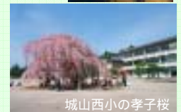
城山西小の桜子桜