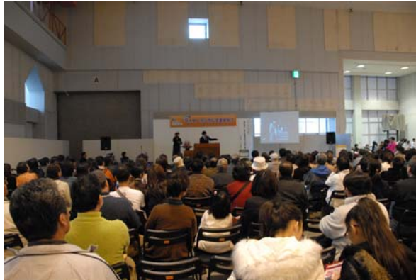
宮っこフェスタ 2008 での基調講演の様子

「宮っこフェスタ 2008」では、ファザーリング事業として、基調講演や啓発パネル展示、ファザーリングを推進する市民団体によるブース出展や活動報告などを行い、フェスタ全体で 11,000 人が参加しました。