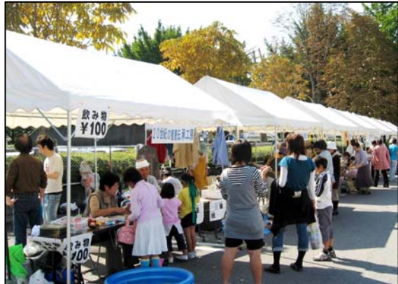
フェスティバルの様子