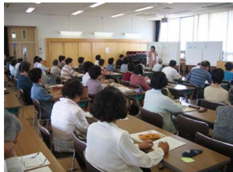
市民講座（出前講座）の様子

自治会やサークル、協議会などからの要請に応じて、希望テーマに沿った講師を市が派遣し、「家庭教育」や「子育て支援」、「DV」などの男女共同参画をテーマにした出前講座を年8回開催し、400人の市民が参加しました。