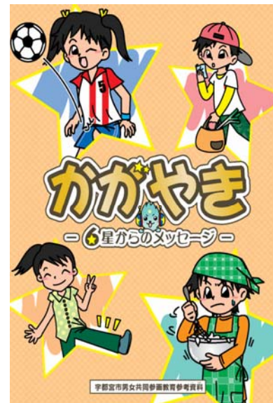
教育参考資料「かがやき」

また、ゲームや紙芝居などを交えながら、「かがやき」の内容の理解を深める出前講座を実施しました。