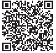
▲難病の医療費助成制度 QRコード

新たに追加された病気の主なものは、オスラー病、筋ジストロフィー、結節性硬化症、前頭側頭葉変性症、