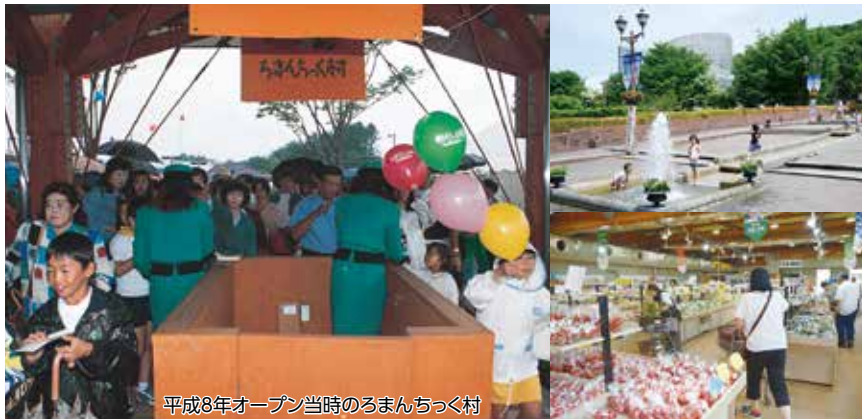
平成8年オープン当時のろまんちっく村

豊富な水資源や長い日照時間など、農業にとって恵まれた環境の宇都宮では、ナシ・トマト・イチゴなどおいしい農産物が作られています。ろまんちっく村は、農業の素晴らしさを味わってもらおうと、市制100周年記念事業の一環で平成8年9月に農林公園としてオープンしました。さらに、平成24年9月には、市内初の「道の駅」としてリニューアルオープンし、市外からも多くの人々が訪れます。