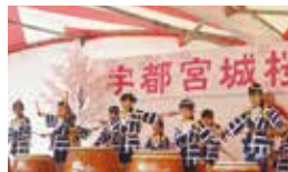
1 4月1～10日 かまがわ川床まつり。2 3月20日 宇都宮クリテリウム。3 4月2～10日 清原さくら祭り。4 3月26日 宇都宮城桜まつり。