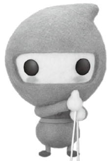
▲厚生労働省給付金キャラクター「カクニンジャ」

賃金引き上げの恩恵が及びにくい所得の低い高齢者を対象に、給付金を支給します。支給の対象となる可能性のある人へ4月25日から申請書を郵送しますので、必要事項を書き、提出してください。