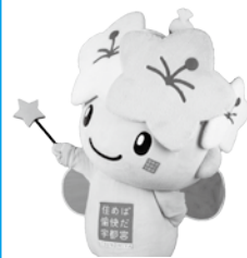
▲特別PR担当 ミヤリー