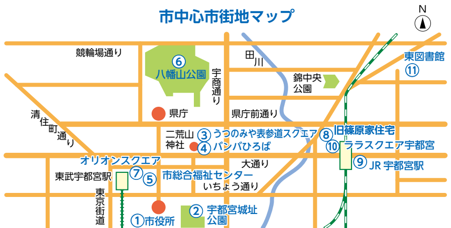
市中心市街地マップ