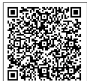
▲携帯サイト用QRコード