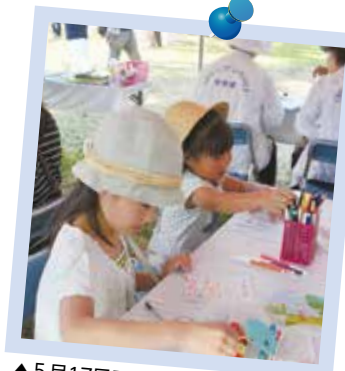
▲5月17日フェスタ マイ 宇都宮2015