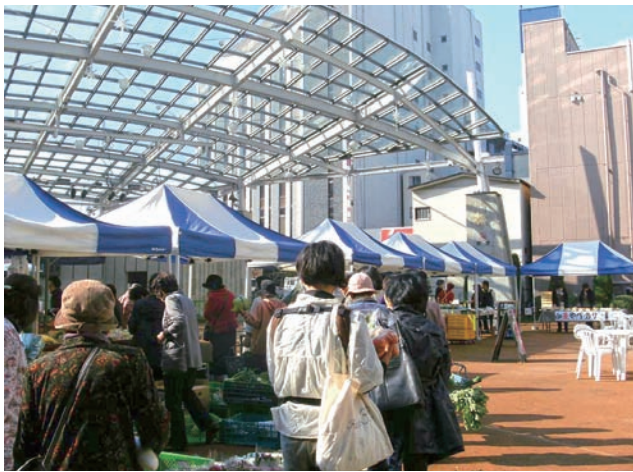
▲オリオン朝市は、毎月第1・3火曜日に開催しています。