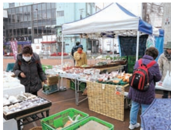
■オリオン朝市 ▽日時 3月4・18日(火)、午前10時～午後2時。 ▽会場 オリオンスクエア。