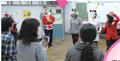
▲社会参加体験では、クリスマス会も行いました。