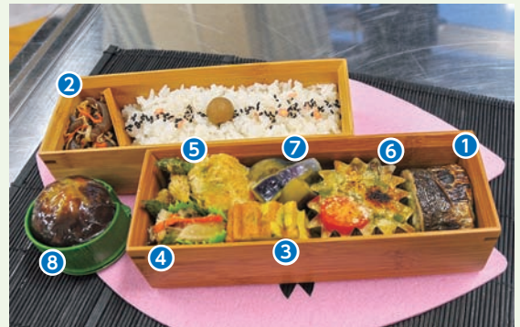
1 秋刀魚のさる文様焼き 2 雷都こんにゃく 3 栃木巻 4 干し野菜のごま酢和え 5 桜エビと里芋のおやき 6 鰯とひじきのとろろ焼き 7 なすのお浸し アスパラのみそ和え 8 水ようかん