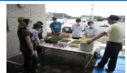
サギソウの鉢植え講座

身近な生涯学習の拠点として様々な学習活動やまちづくり活動を支援するとともに、社会環境が急激に変化する中において、社会の要請に対応する事業や人間力の向上、家庭・地域の教育力の向上に資する事業に取り組んでいる。