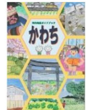
河内地区ガイドブック「かわち」