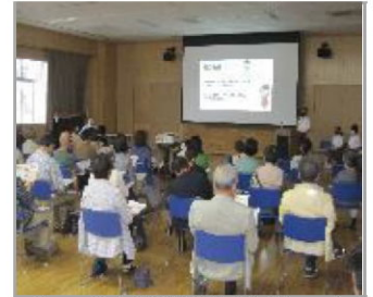
●「いきいき河内発見講座」中学生がどうしても伝えたい「かわち」の魅力の模様 市民センターに隣接する古里中学校の3年生が講師となり、地域住民を対象に講座を開催。

●河内地区まちづくり協議会楽しいプロジェクトガイドブック編集委員が中心となり、河内地区のあゆみや文化財、自然などについて、まとめた河内地区住民向け情報紙を発行