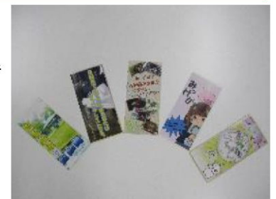
入選したPRリーフレット

●中学生が直接現場を取材して作成したPRリーフレットを活用し、寸劇やクイズ等を織り込み地域の資源を分かりやすく工夫しながら説明したことで多くの参加者から高評価をいただいた。また、PRリーフレットは、これから河内地区の住民になる方々へにまちの魅力を発信するための有効なアイテムとなる。