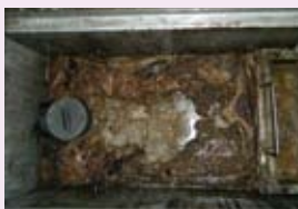
グリストラップ清掃前

注) 容量計算で清掃周期を決定している場合は、周期を守って清掃しましょう。また、清掃時に発生した油等は産業廃棄物になるので、専門業者に処分を依頼してください。