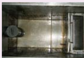
グリストラップ清掃後