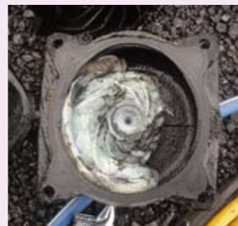
ポンプに詰まった水に溶けにくい紙

中継ポンプが停止すると、汚水があふれ、周辺の皆さんが下水道を使用できなくなることがあります。下水道はルールを守って正しく使いましょう。