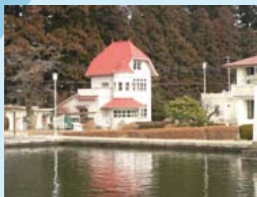
▲今市浄水場 日本で 31 番目に古い浄水場です。