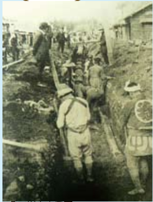
▲日の工事風景 今のような機械はなく、すべて手作業でした。