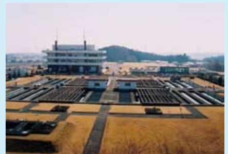
▲松田新田浄水場 北関東最大級。1日最大配水量113,500m 3 。

日本で最初の水道は、今から約400年前の江戸(現在の東京) 1590年、日本で初めての水道「小石川水道」が神田川から江戸 城下に引かれました。当時の江戸は約100万人もの人口を抱 えた世界最大規模の都市だったそうで、水道の普及は多くの 人々の暮らしを支えました。