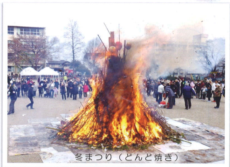
冬まつり（どんど焼き）