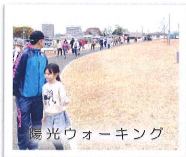
陽光ウォーキング