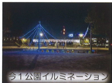
今1公園イルミネーション