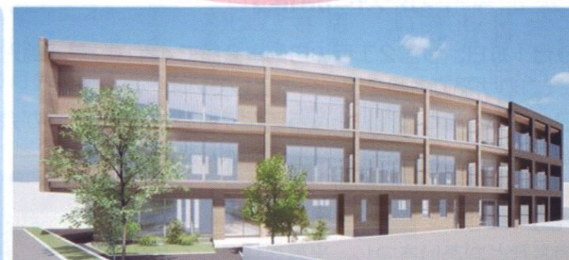
名称/サービス付き高齢者向け住宅 コープの家 所在地/宇都宮市緑5丁目13-9

社会福祉法人ふれあいコープは、とちぎコープ生活協同組合を母体として2006年に設立されました。栃木県で介護保険事業を中心に、子どもから高齢者まですべての人が安心して暮らしていける地域づくりを目指しています。「コープの家」は、とちぎコープ生活協同組合から委託を受け、ふれあいコープが運営を担います。