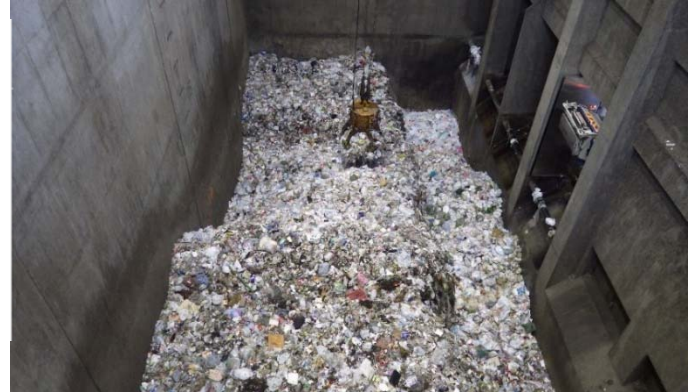
↓クリーンセンター下田原のごみピットの状況