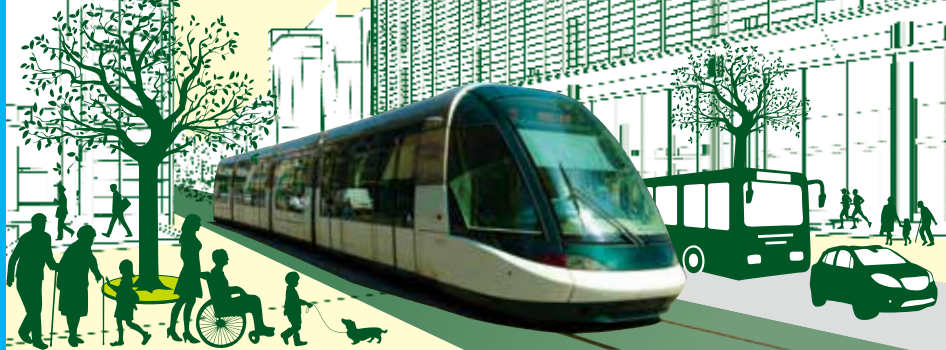
LRTの車両はイメージです(写真はストラスブール(仏)の車両)

宇都宮市は、公共交通にLRTが加わることで、バスなどの他の交通手段も便利になり、もっと活力のあるまちへと変わります。今回は、LRT事業の整備費について、皆さんから寄せられるご質問にお答えします。