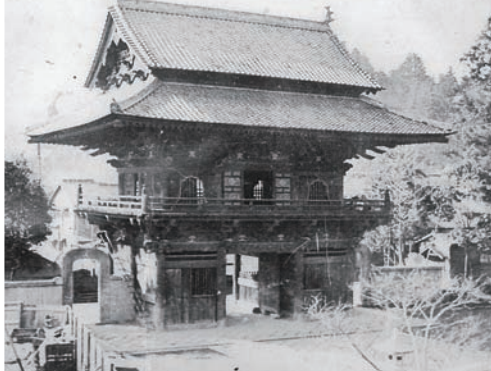
▲焼失前の赤門（赤門大復興より）