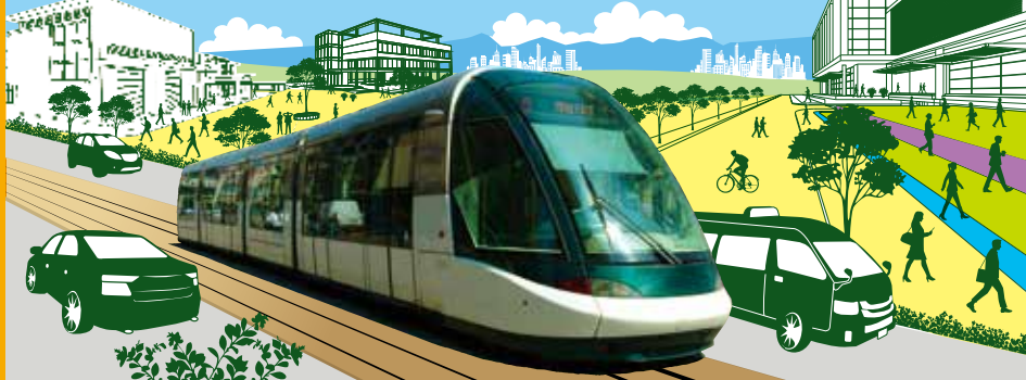
LRTの車両はイメージです(写真はストラスブル(仏)の車両)

宇都宮市は、公共交通にLRTが加わることで、バスなどの他の交通手段も便利になり、もっと活力のあるまちへと変わります。今回は、LRT開通後の渋滞対策に関するご質問にお答えします。