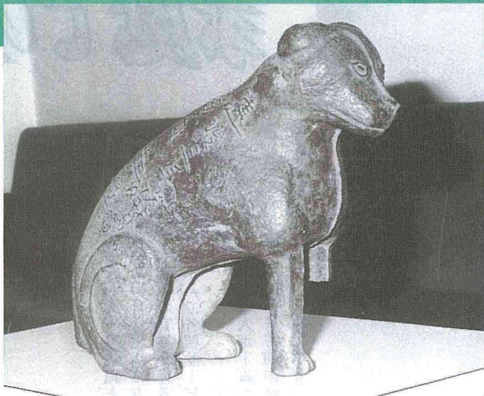
▲左前足が欠けている