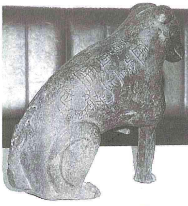
◀背中には大きな文字が