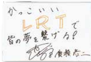
1984年3月13日、京都生まれ。166cm、64kg。サガン鳥栖から2010年に栃木SCに加入し、今期で8シーズン目を戦う。キャプテンは4季連続。酸いも甘いも経験した33歳の絶対キャプテンは背中チームを引っ張る。