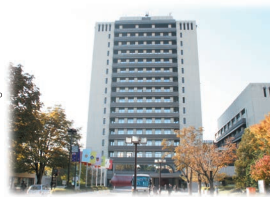
宇都宮市役所本庁