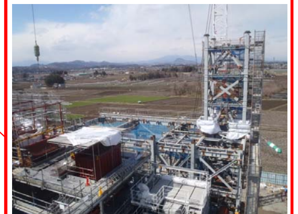
炉室エリア(ごみ焼却棟)