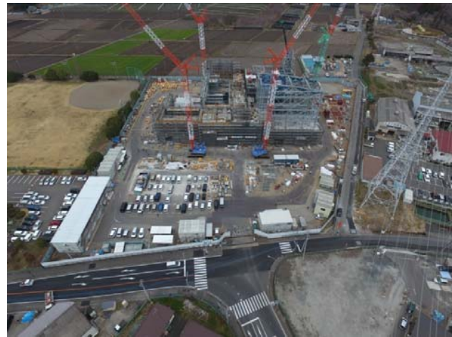
航空写真(建設地全体)