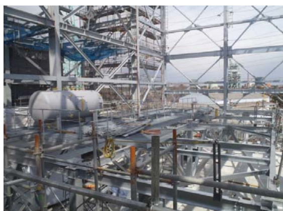
発電エリア(ごみ焼却棟)