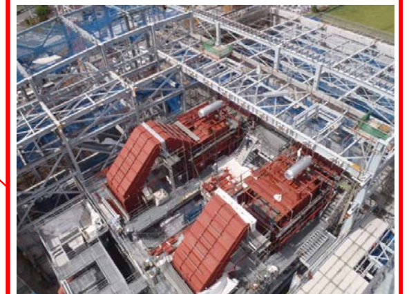
炉室エリア(ごみ焼却棟)