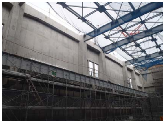
ごみピットエリア(ごみ焼却棟)