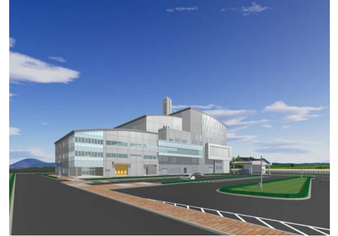
完成イメージ(南西からの見上げ)