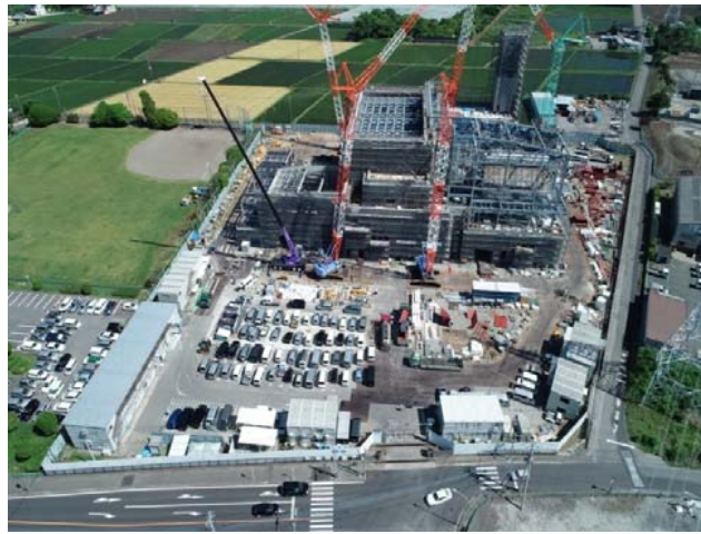
航空写真(建設地全体)