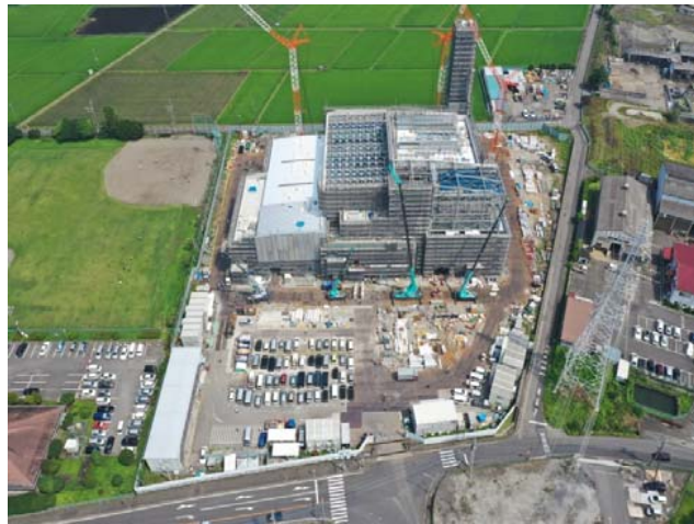
航空写真(建設地全体)