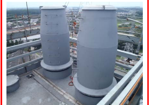
炉室エリア(ごみ焼却棟)