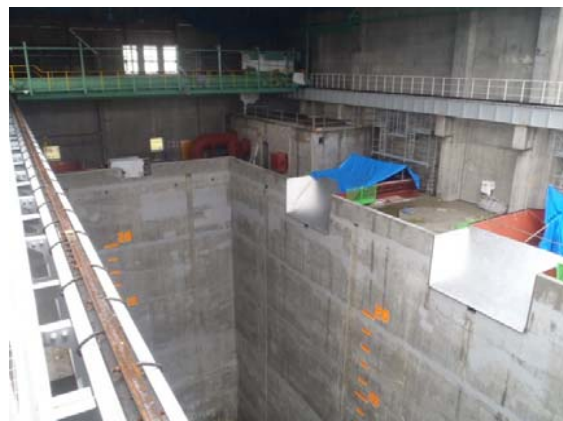
ごみピットエリア(ごみ焼却棟)

手すりやデッキ、可燃性粗大ごみ切断機、ダンピングボックスの取り付けを行っております。