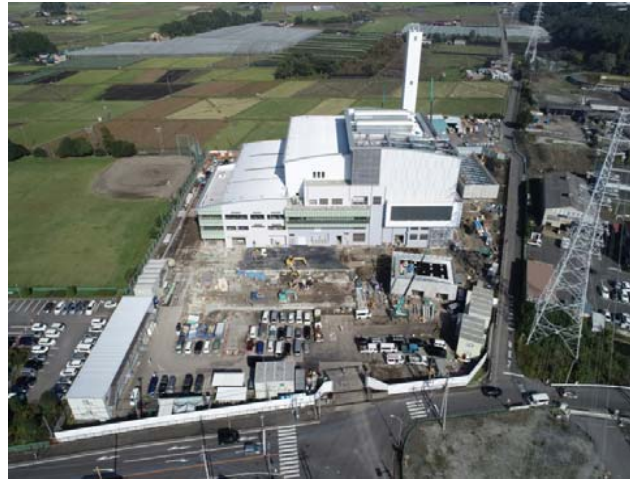
航空写真(建設地全体)