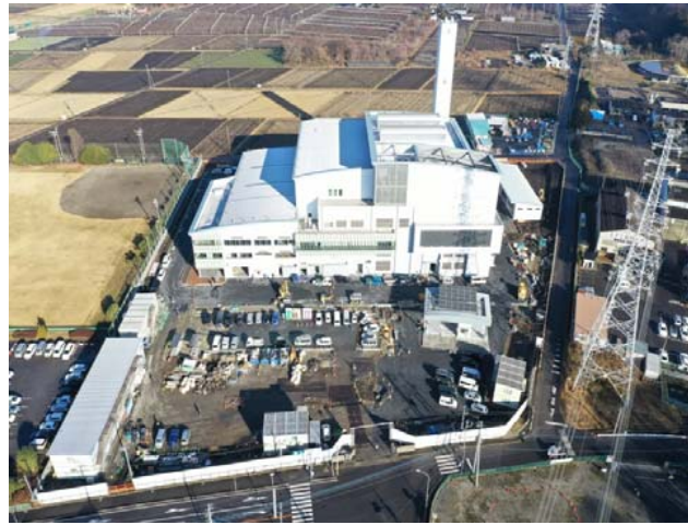
航空写真(建設地全体)