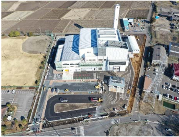
航空写真（建設地全体）