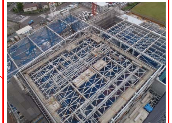
炉室エリア(ごみ焼却棟)