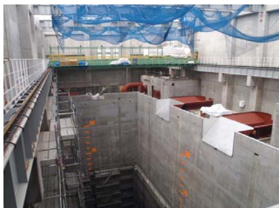
ごみピットエリア(ごみ焼却棟)