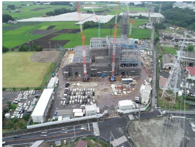
航空写真(建設地全体)