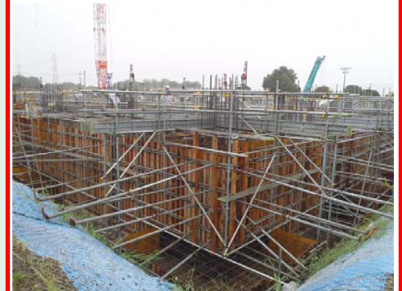
炉室・発電エリア基礎(ごみ焼却棟)