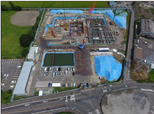
航空写真(建設地全体)