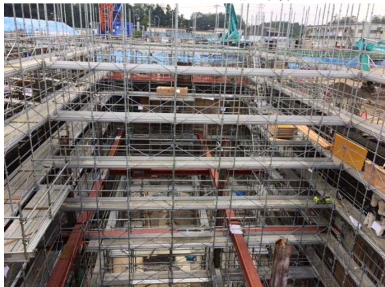
ごみピット(ごみ焼却棟)