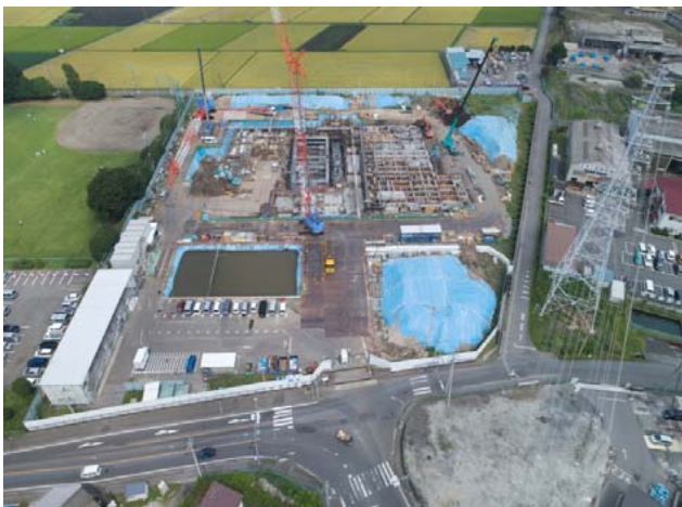
航空写真(建設地全体)