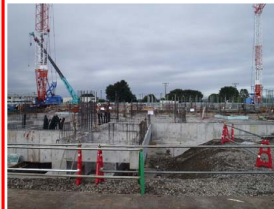
炉室・発電エリア基礎(ごみ焼却棟)