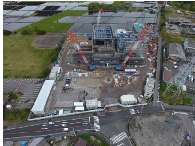
航空写真(建設地全体)