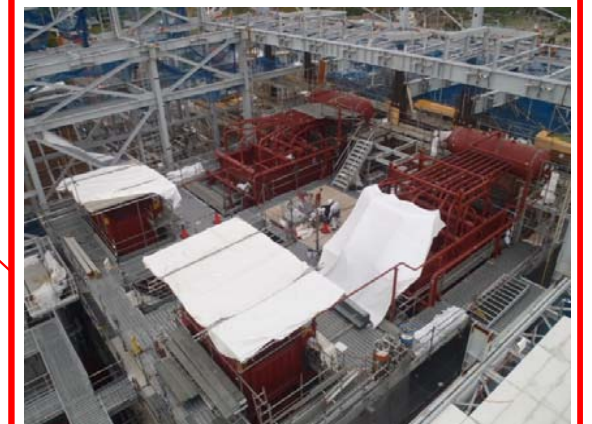
炉室エリア(ごみ焼却棟)