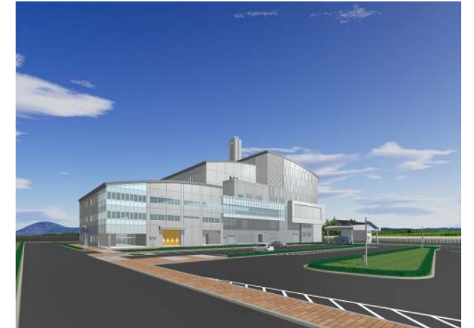
完成イメージ(南西からの見上げ)