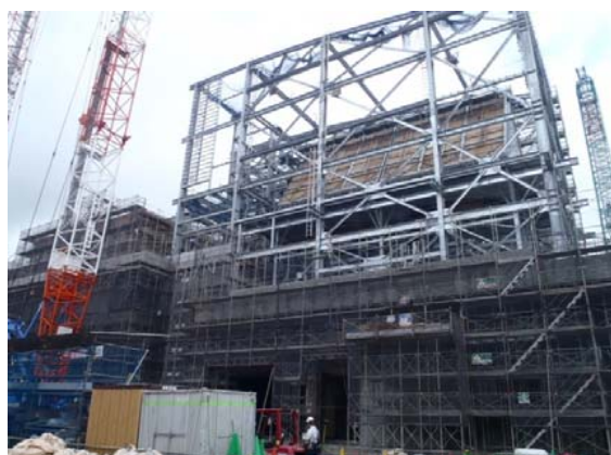
発電エリア(ごみ焼却棟)