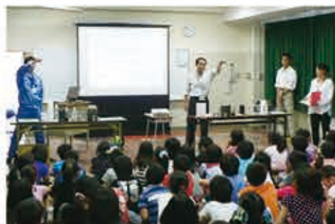
小学校でのお届けセミナーの様子

対 象 市内に在住または通勤・通学している、10人以上で構成された団体 申 込 開催希望日の1か月前までに、経営企画課まで電話でお申し込みください