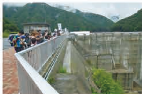
探検ツアーの様子

日 時 平成30年7月29日(日)午前9時～午後4時予定 コ ー ス 普段は見る事が出来ない上下水道の施設を巡ります 対 象 市内に在住または通勤・通学している小学生とその保護者 定 員 40人(定員を超えた場合は抽選) 申 込 7月13日(必着)までに、郵便またはFAX・Eメール(参加者全員の氏名(ふりがな)・住所・電話番号・お子様の学年を明記してください)、経営企画課までお申し込みください