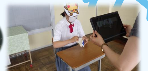
食事のマナー（全学年）