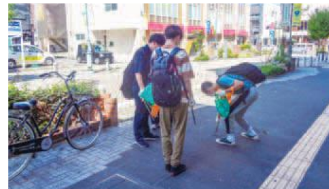
飛鳥未来さずな高校と連携した清掃活動

クリーンアップ運動では、地元の商店街や高校と連携し、中心市街地の清掃活動を行いました。