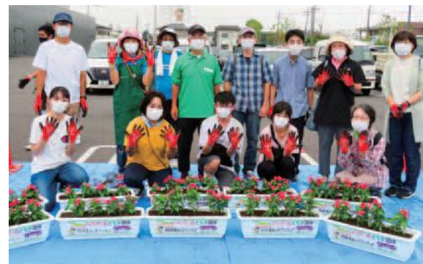
自治会・ボランティアの方々と競技会場へ設置する花プランターを作成