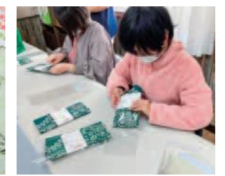
障がい者就労支援施設による記念品の梱包作業