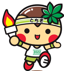
いちご一会とちぎ国体・とちぎ大会 マスコットキャラクター「とちまるくん」