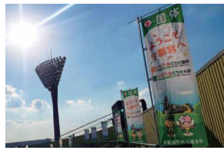
宇都宮清原球場(野球)