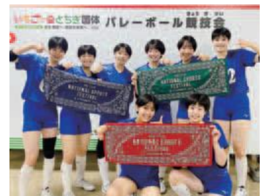
バレーボールの選手