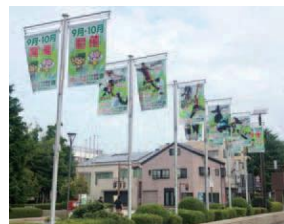
ロータリー掲揚ポール