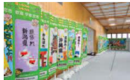
本大会（バスケットボール会場）