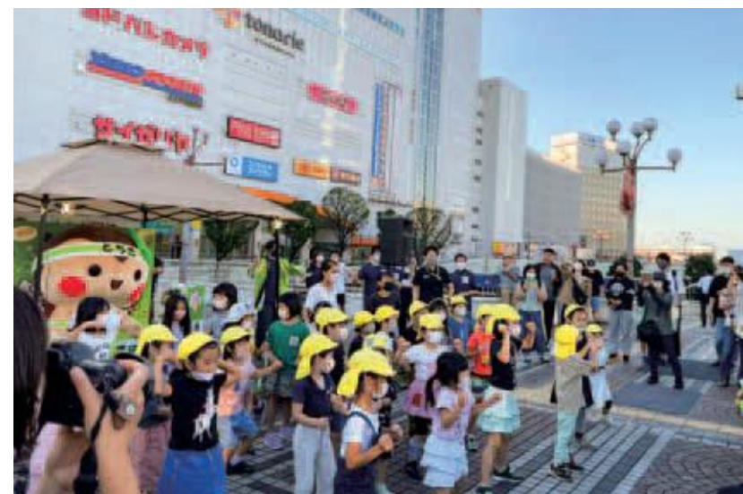
子どもたちととちまるくんによる国体ダンスの披露

宇都宮共和大学の学生が中心となり、築瀬地区まちづくり推進協議会など、関係団体の協力を得ながら、JR宇都宮駅で国体おもてなしイベント「ペデフェス!」を開催しました。