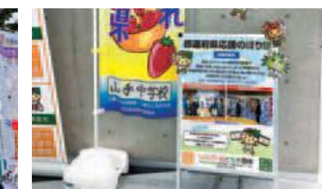
先催市ののぼり旗の紹介パネル