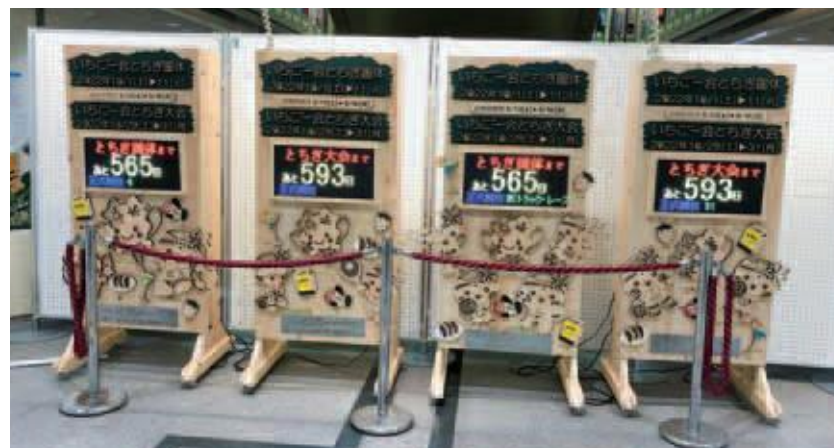
完成したカウントダウンボード

宇都宮工業高等学校の生徒が、いちご一会とちぎ国体・とちぎ大会までの日数をカウントするカウントダウンボードを制作しました。カウントダウンボードは、建築技術を用いた技巧で組み立てられており、電光掲示板の部分は、プログラミングによりGPSを利用した残日数カウントに加え、本市開催競技の紹介もされています。