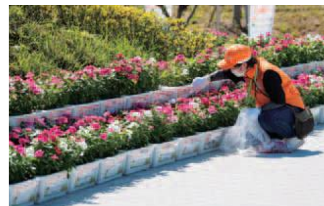
競技会場において、花から摘みを行うボランティア