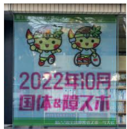
行政情報センター