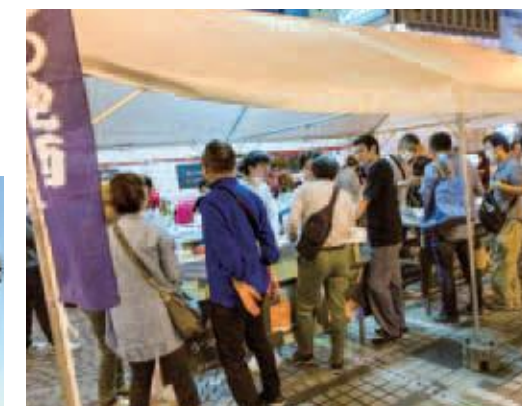
とちぎ地元の酒で乾杯フェスタ実行委員会による地ビールや地酒の飲み比べブース