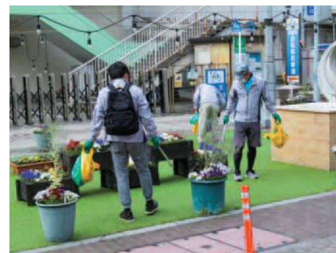
宇都宮中心商店街活性化委員会と県・市事務局員による中心市街地の清掃活動