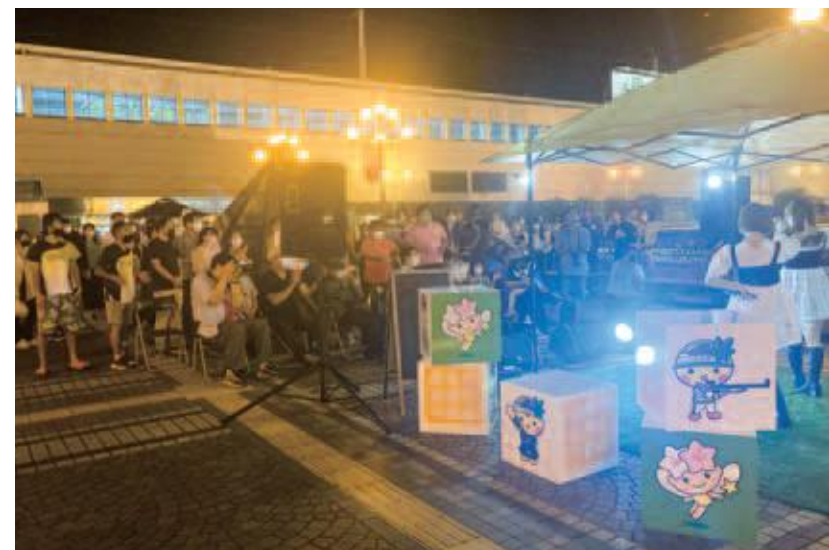
栃木県のリアル姉妹ユニット「Lovin & S」によるステージイベント