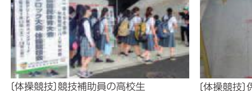
〔体操競技〕競技補助員の高校生