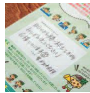
応援のメッセージ