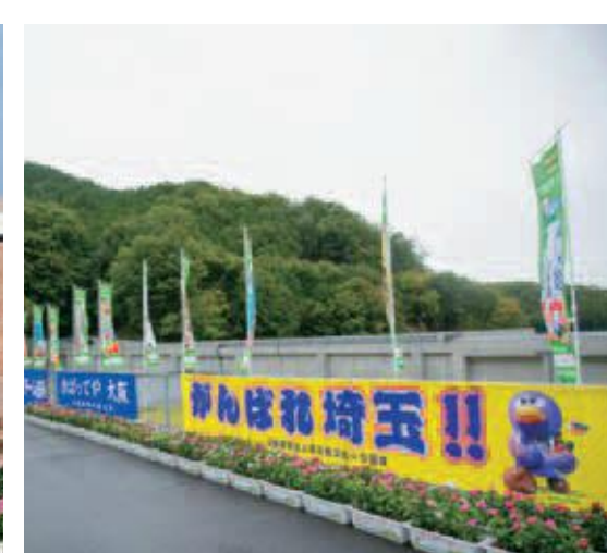
のぼり旗とともに花プランターが選手を後押し