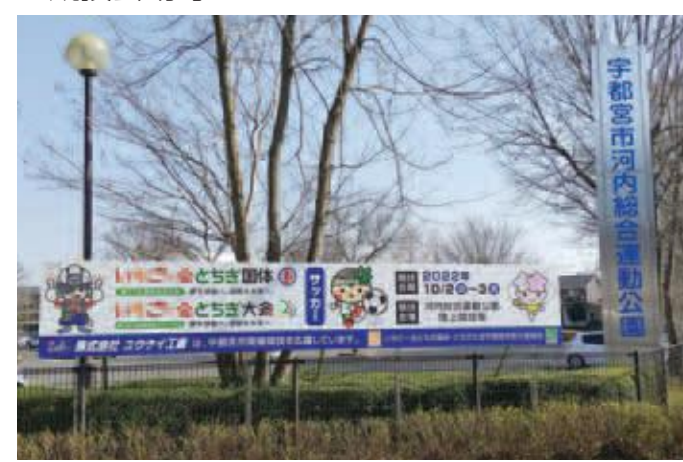
河内総合運動公園