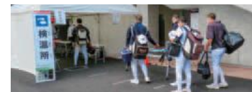
〔高等学校野球(軟式)〕検温所