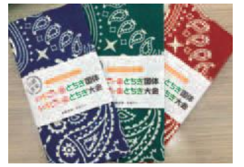
一般販売用の宮染め手ぬぐい