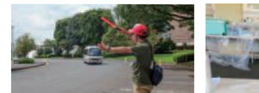
〔バレーボール〕車を誘導する係員