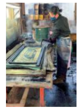
③染めの伝統的な工程「注染」