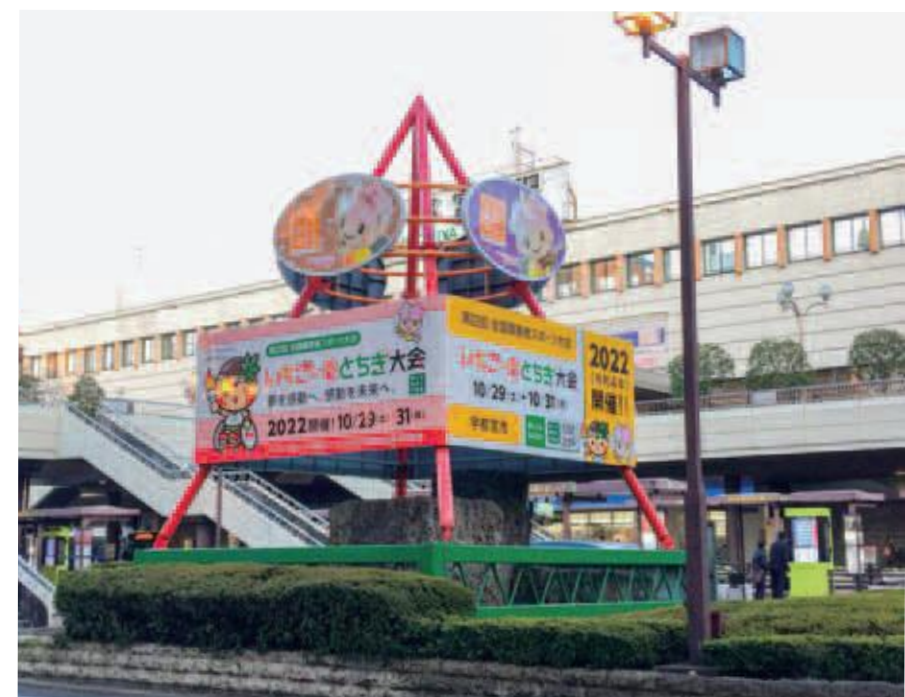
JR宇都宮駅西口広告塔

国体開催に向けて、競技会場をはじめ、JR宇都宮駅や中心市街地など市内各所にPR・歓迎装飾を実施し、全国から訪れる選手・監督や一般観覧者を温かく迎えました。