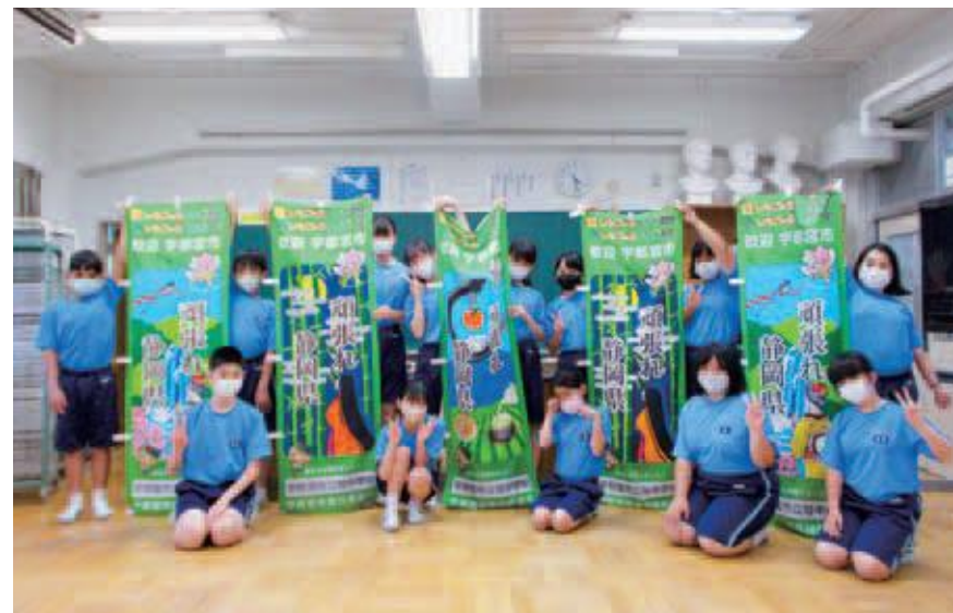
完成したのぼり旗と記念写真