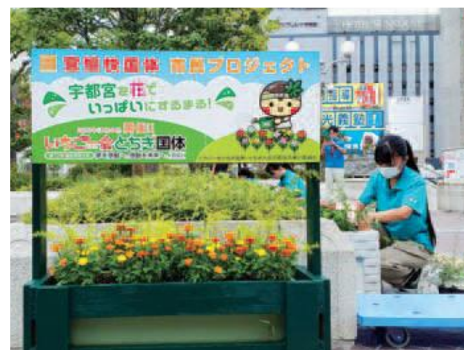
宇都宮白楊高校生徒によるJR宇都宮駅前の装飾