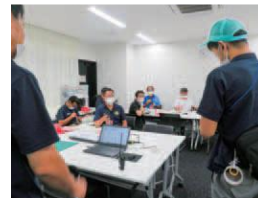
〔バスケットボール〕実施本部 朝のミーティング