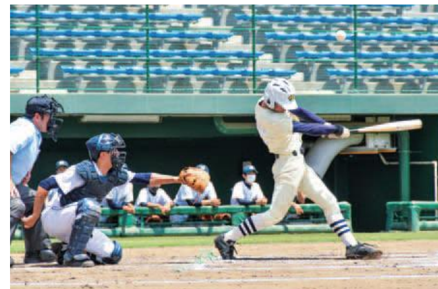
〔高等学校野球(軟式)〕

いちご一会とちぎ国体の本番に向け、宇都宮市内の各競技会場でリハーサル大会が行われました。参加者への体調管理チェックシートの提出義務付けや、入口での検温、会場内の消毒などの感染症拡大防止対策を講じ、コロナ禍での国体開催を想定した課題の洗い出しを行いました。