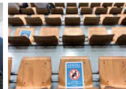
〔剣道〕座席のコロナウイルス対策