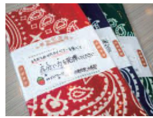
応援メッセージ付きの参加記念品