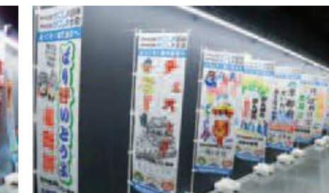
鹿児島市ののぼり旗