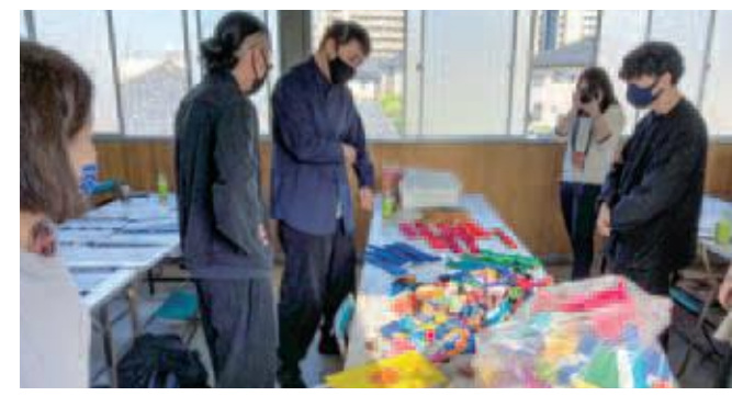
①数ある色の中から記念品の色を選定