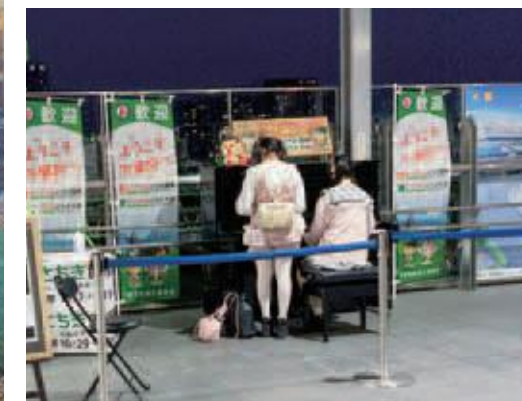
「宇都宮ジャズ協会」による駅ピアノ設置