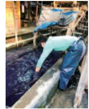
④のりを洗い流す工程