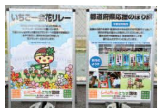
市民運動を紹介したパネル(栃木県ライフル射撃場)