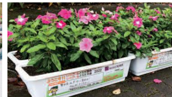
応援メッセージが記載された花プランター