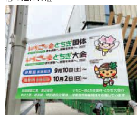
JR宇都宮駅東口の矢羽サイン