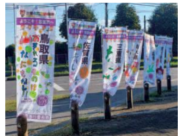
先催市から引き継いだ都道府県応援のぼり旗