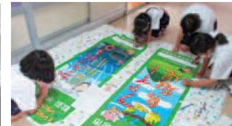
各地の特徴を活かしたデザイン