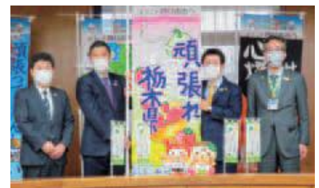
三重県四日市市からの引き継ぎ式