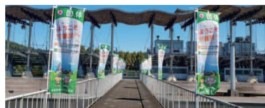
栃木県グリーンスタジアム(サッカー)