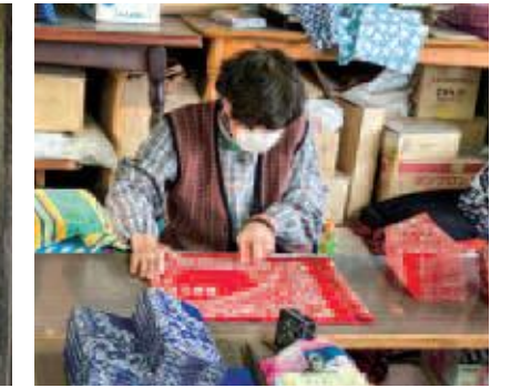
⑥丁寧なたたみ作業