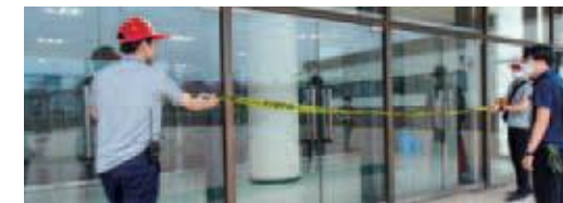
〔バレーボール〕立ち入り禁止の対応