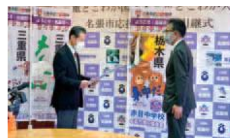
三重県名張市からの引き継ぎ式