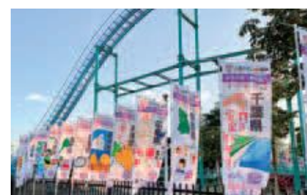
名張市ののぼり旗