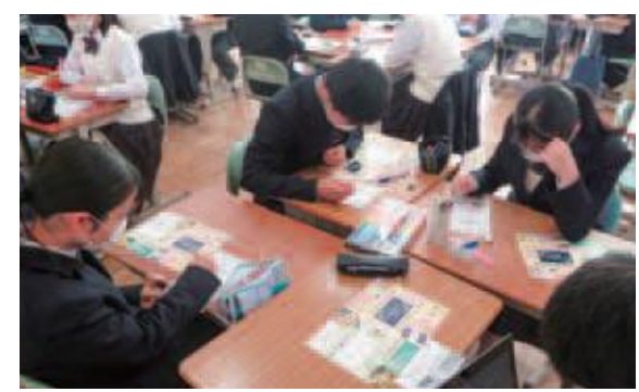
中学生（25校）による手書きのメッセージの記入