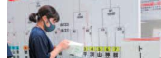
〔バスケットボール〕競技結果の作成