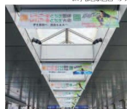
JR宇都宮駅東西自由通路