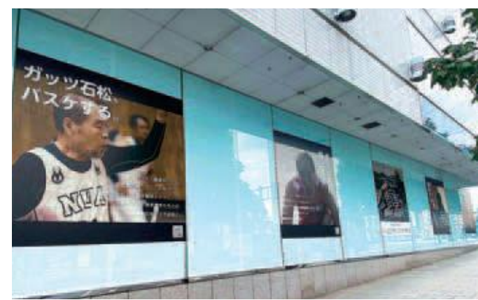
旧パルコガラス面