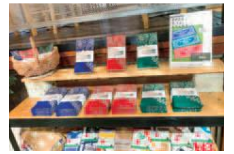
好評につき一般販売された宮染め手ぬぐい