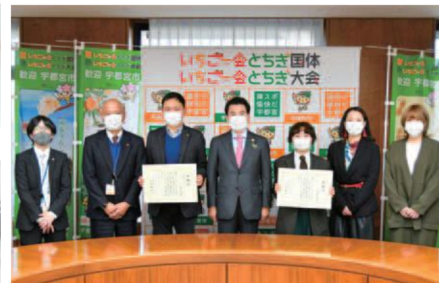
感謝状贈呈式（令和2年度）