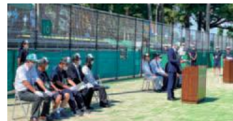
〔テニス〕大会主催者あいさつ