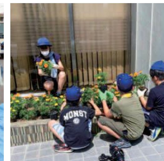
マリーゴールドを植える中央小学校の児童