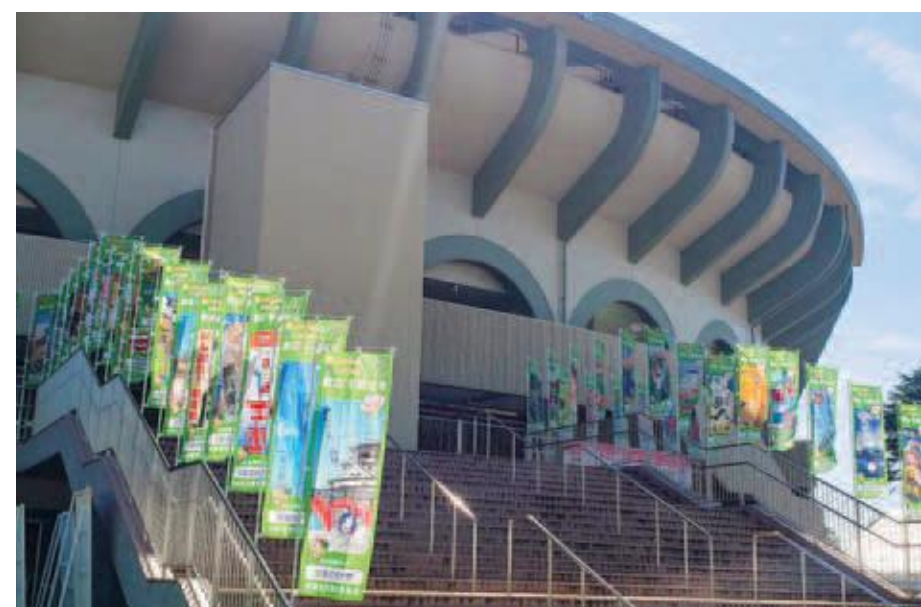
栃木県総合運動公園硬式野球場(野球)