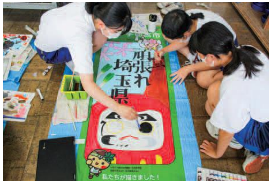
中学生による制作

全国から訪れる選手・監督などを歓迎するため、市内の芸術関連学校の学生や中学生が都道府県応援のぼり旗を制作しました。方言や特産物、観光名所が盛り込まれており、各都道府県らしさのあるデザインとなりました。また、延期・中止となり開催が叶わなかった鹿児島県鹿児島市と三重県四日市市、名張市からも本市に応援のぼり旗が引き継がれ、競技会場に装飾しました。