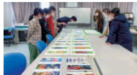
文星芸術大学による制作