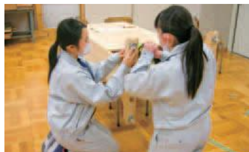
きょうたいが 筐体部