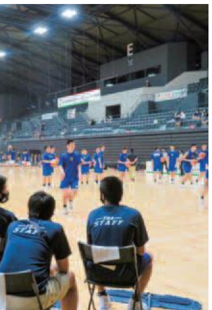
〔バスケットボール〕