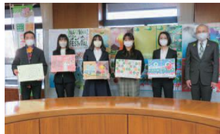
制作に対する感謝状贈呈式

宇都宮大学の学生が美術分野専攻ならではの技術を活かし、各競技(8競技)の競技別プログラム表紙デザインを制作しました。一目見ただけでその競技だとわかる競技ごとの特徴を捉えた迫力あるデザインであるとともに、宇都宮市の観光名所や観光資源等が盛り込まれた本市らしさのあるデザインが完成しました。