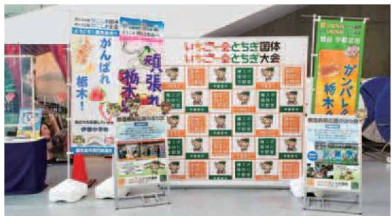
鹿兒島市、四日市市、本市ののぼり旗を並べたフォトスポット