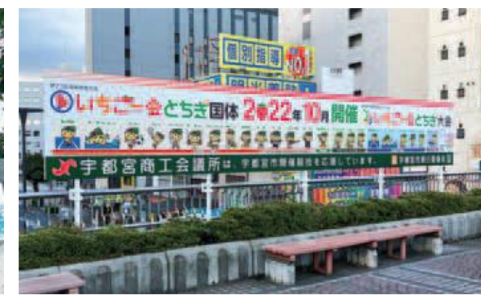
JR宇都宮駅西口ペデストリアンデッキ