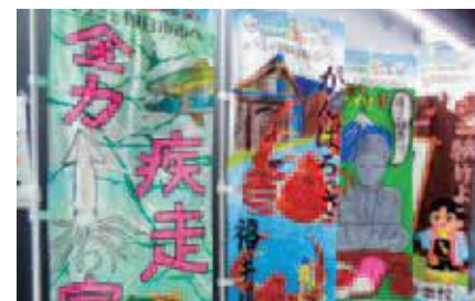
四日市市ののぼり旗