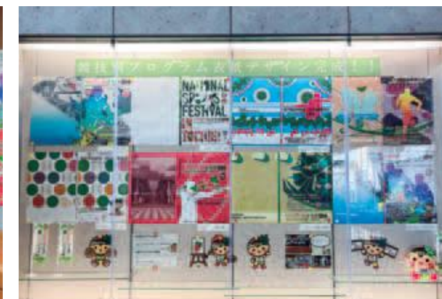
南図書館で展示した競技別プログラムの表紙デザイン