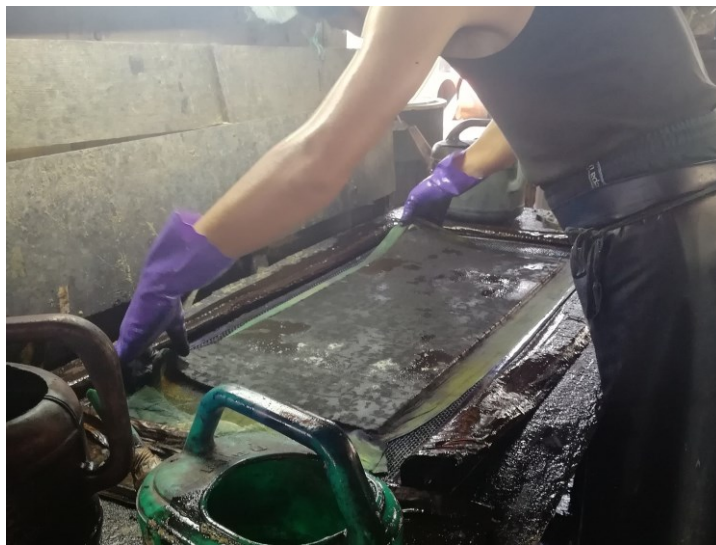
図 1 生地を染め上げている様子

宮染めの実情を調査するために、私たちは 2019 年 7 月 30 日に現存している工場のひとつである中川染工場へ聞き取り調査を行った。中川染工場は、宇都宮市錦 1 丁目の田川沿いに建ち、明治 38 年創業、従業員数 27 名の歴史ある染め物工場である。浴衣、手ぬぐい、のれんなどをすべて手作業で丁寧に仕上げている。図 1 は型紙を使用し生地を染め上げている様子である。中川染工場では生地を両面に柄を出すことのできる注染という染色方法を用いている。