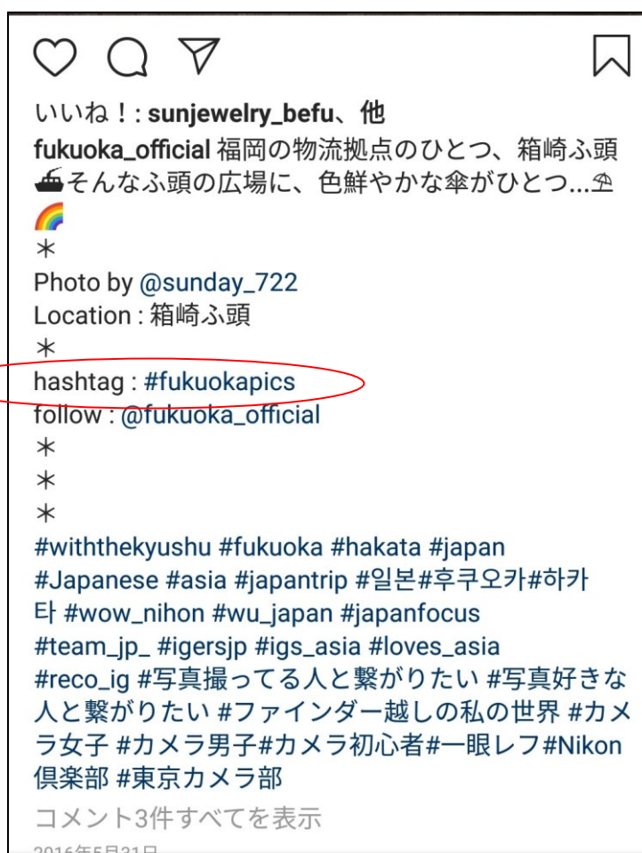
図3 福岡市公式 Instagram のある写真投稿につけられたハッシュタグ群 中央の丸で囲んだ「#fukuokapics」は福岡市が設定したハッシュタグである。